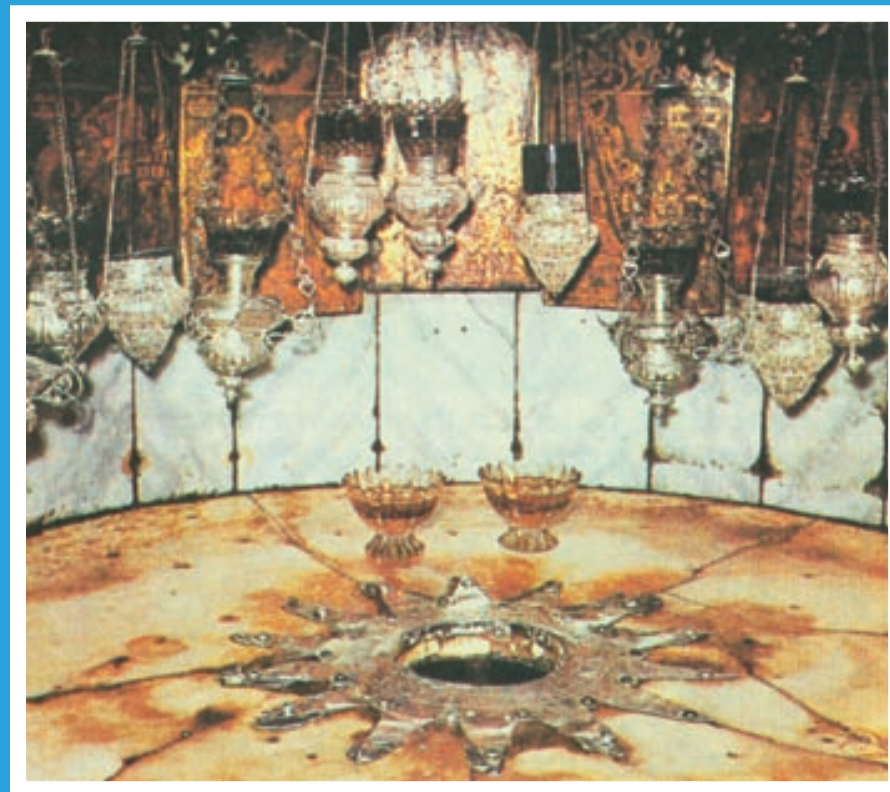
Betlehem – Jézus Krisztus születésének helye