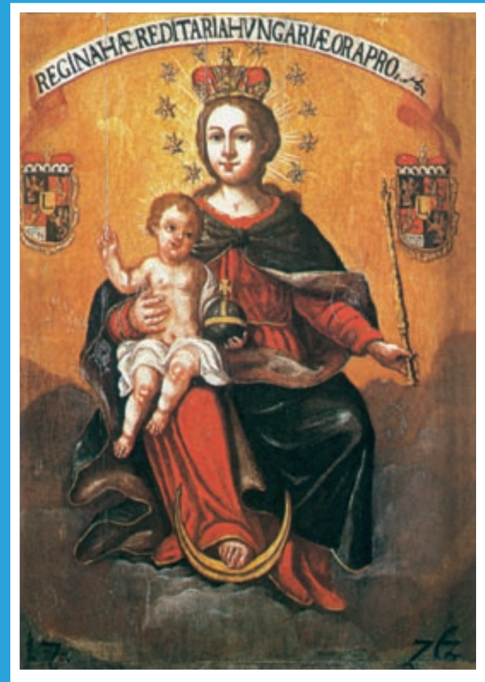
Fraknó – kegykép