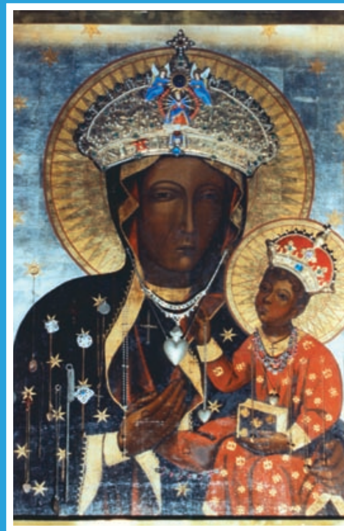
Sopronbánfalva – kegykép