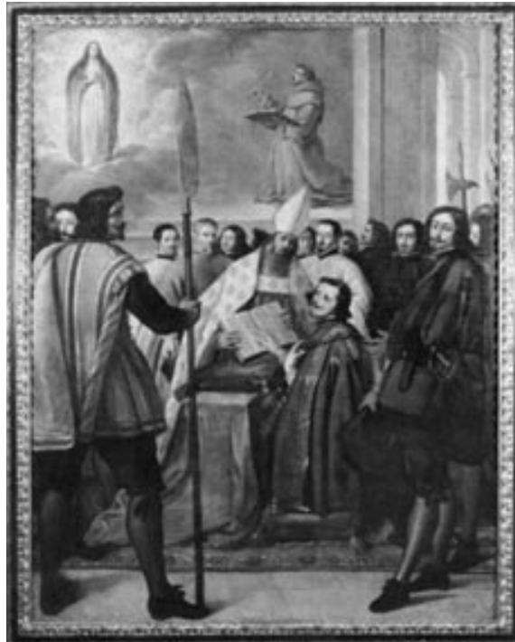
IV. Fülöp spanyol király esküt tesz a Szepőlételen Fogantatás dogmájának védelmezésére.