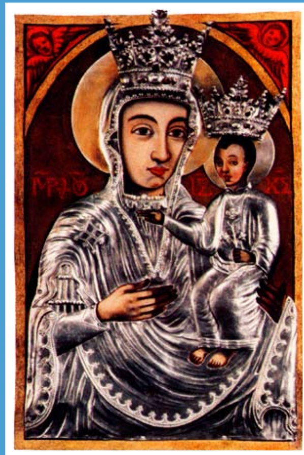
Kegykép – Bakócz Kápolna, Esztergom