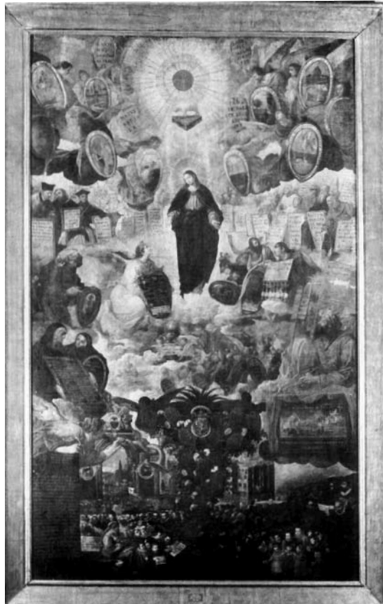
A Szepplőtelen Fogantatás megdicsőülése (festmény)