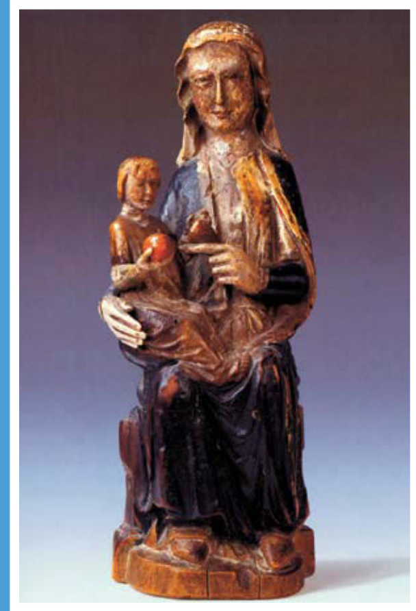
Máriacell – kegyszobor