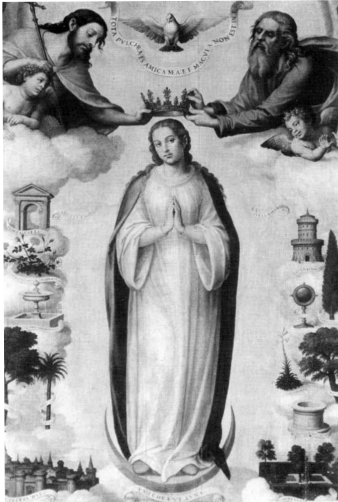
Juan de Juanes (1523–1576) Szeplőtelen Fogantatás, Jezsuiták temploma, Valencia