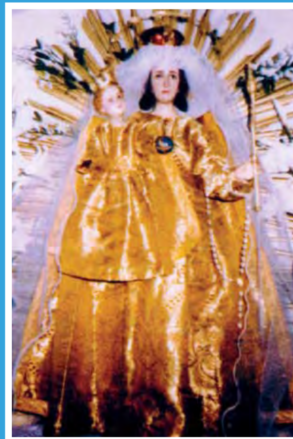
Karancsság – kegyeszobor