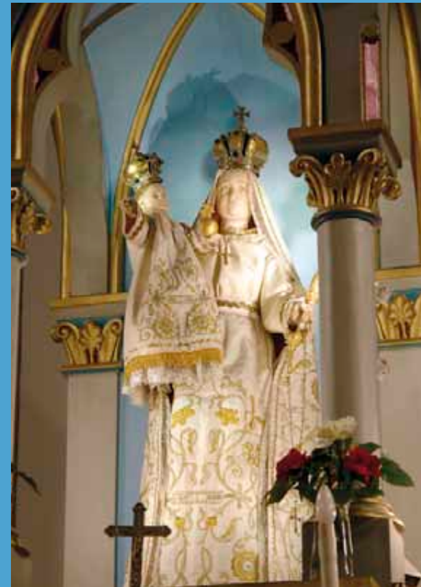
Röjtökmuzsaj – kegyeszobor