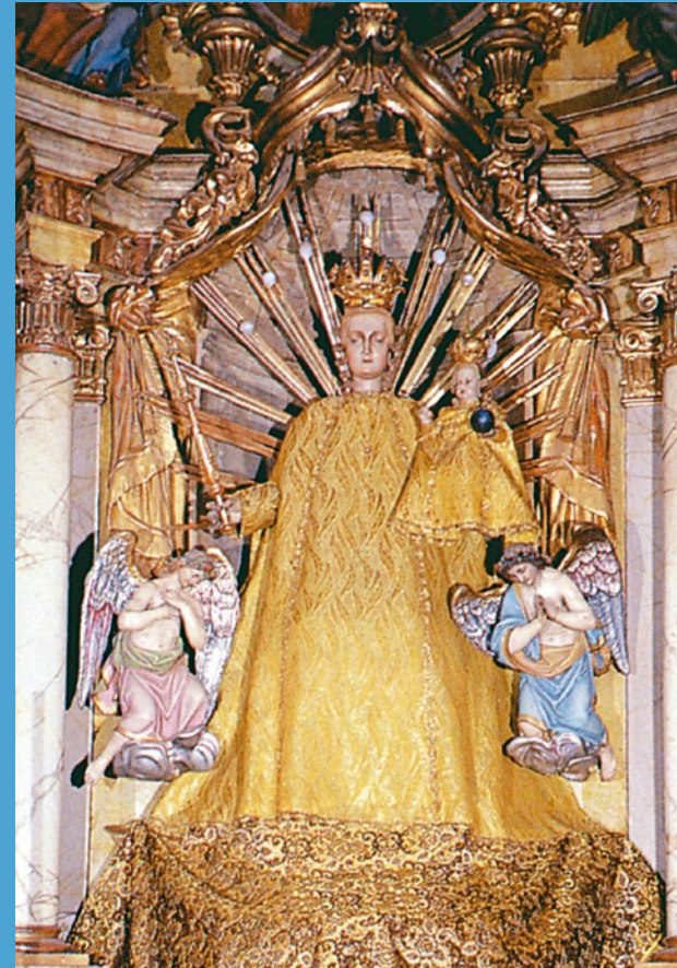
Vasvár – kegyzsobor