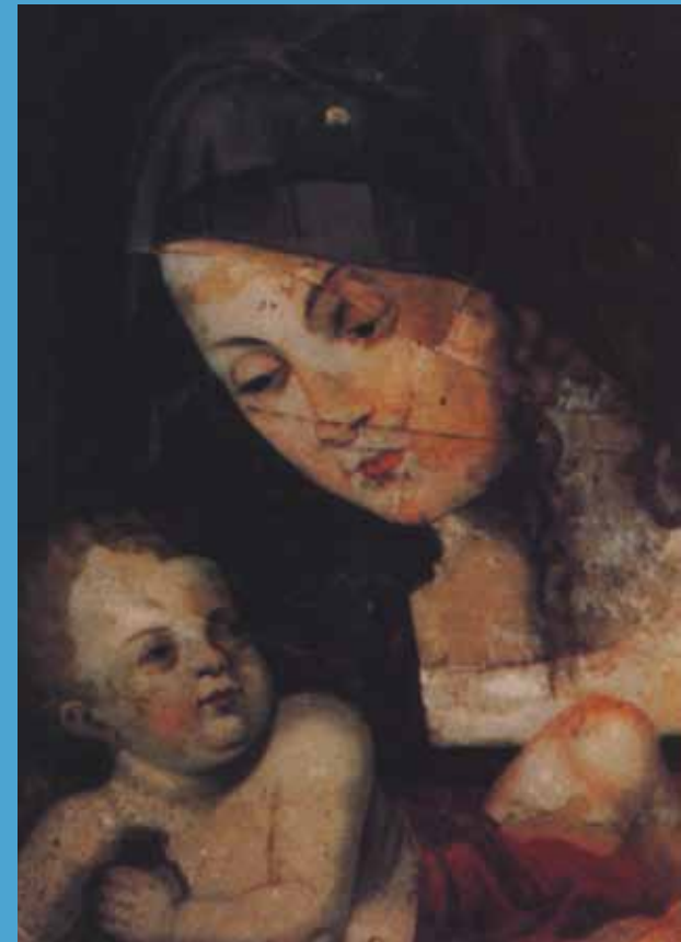
Homokkomárom – kegykép