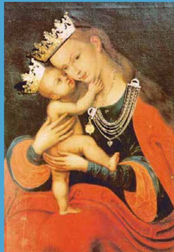
Bodajk – kegykép