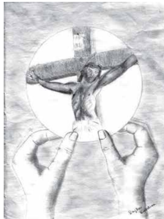
(Rajzolta: Rajkai Krisztina, Szent Gellért Gimnázium)