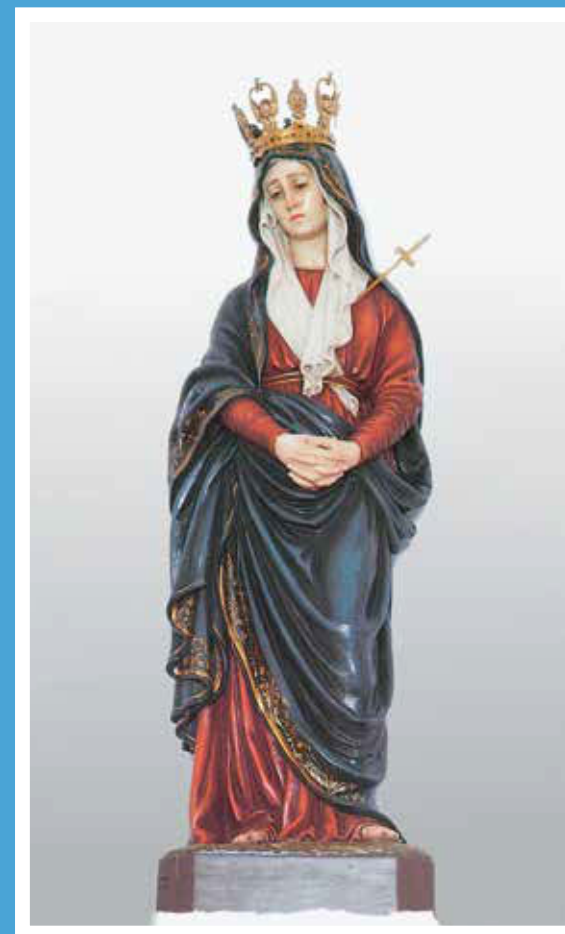
Törökszentmiklós – kegyeszobor