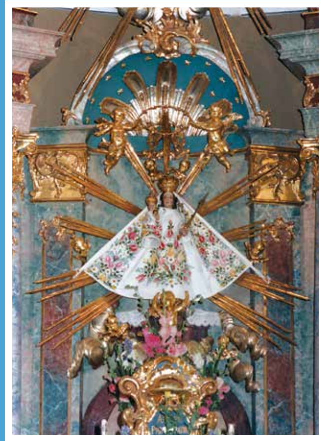
Oslí – kegyszobor