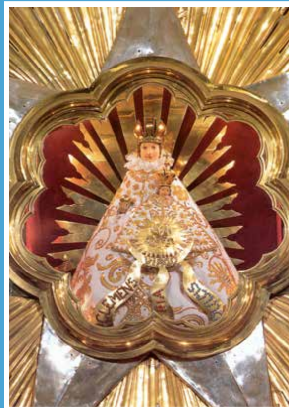
Máriavölgy – kegyeszobor