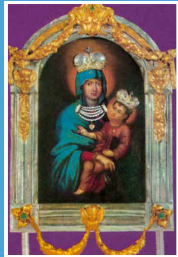
Tekia – kegykép