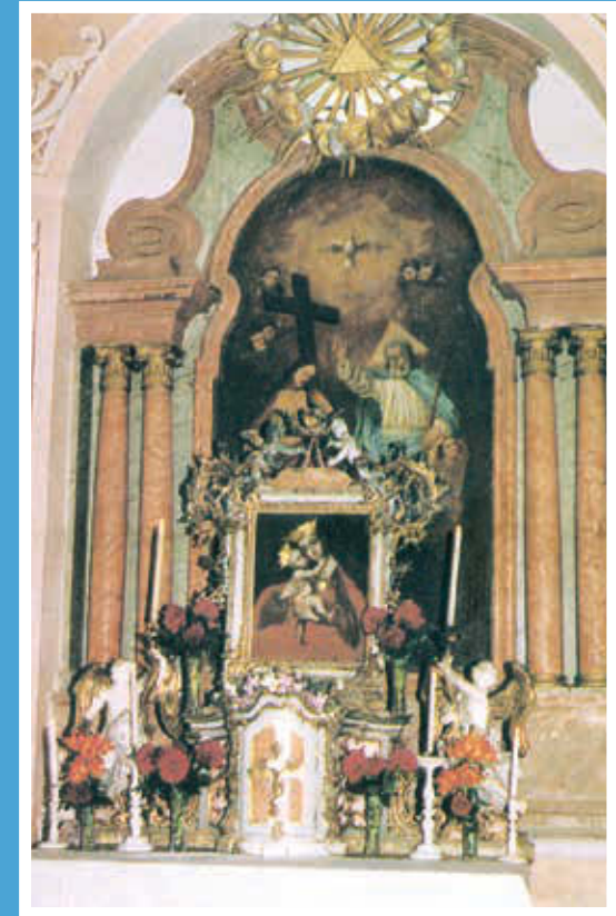
Csicsó – kegykép