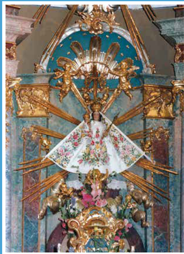
Osli – kegyszobor