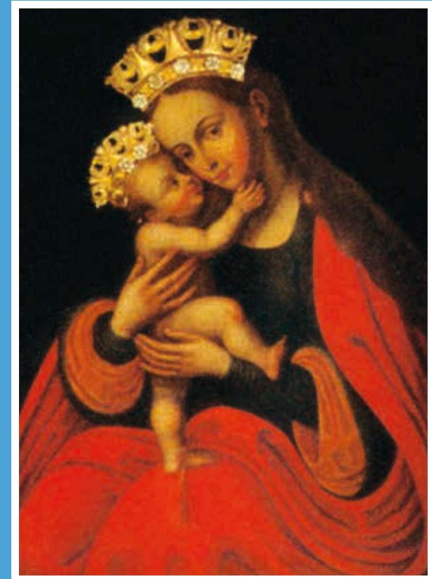
Turbék – kegykép