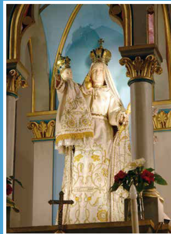
Röjtökmuzsaj – kegyzsobor