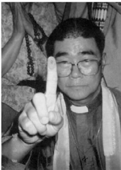
A jobb kéz mutató újján a vércsepp