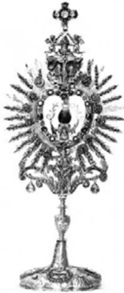
Ludbreg – Szent Vér ereklye (történetét lásd 135. old.)