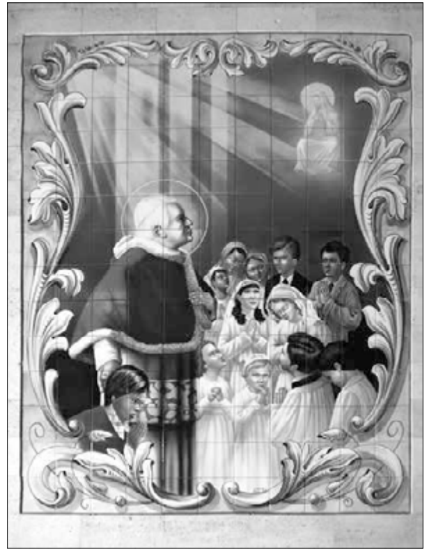
Szent X. Piusz pápa elsőáldozó gyermekekkel (Karagandai Székesegyház)