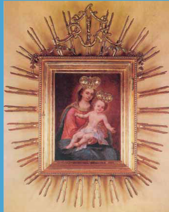
Baja – Máriakönyve